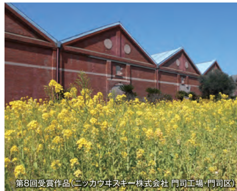
第8回受賞作品(ニッカウヰスキー株式会社 門司工場・門司区)