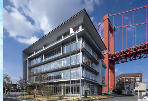
第9回受賞作品(新鶴丸ビル・若松区)