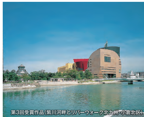
第3回受賞作品(紫川河畔とリバーウォーク北九州・小倉北区)