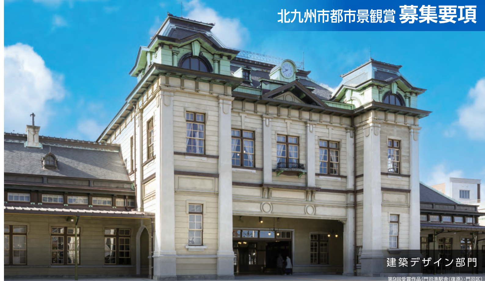
建築デザイン部門