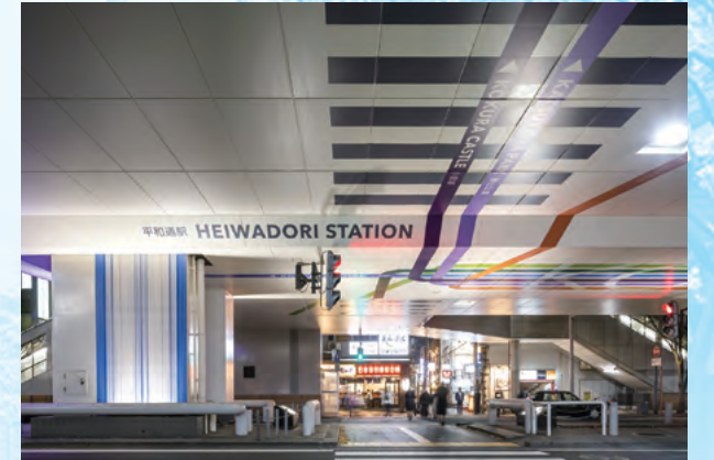
第9回受賞作品(北九州モノレール 平和通駅周辺・小倉北区)