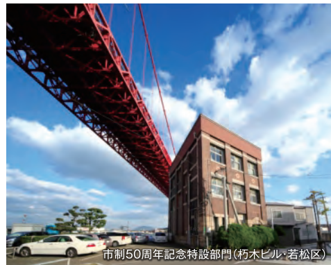
市制50周年記念特設部門(朽木ビル・若松区)