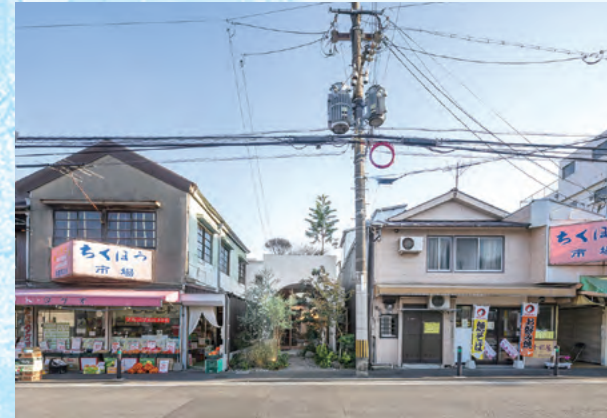
第9回受賞作品(フレンチレストランNALA・八幡東区)