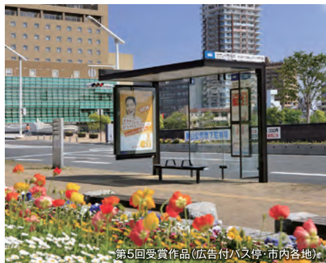
第5回受賞作品(広告付バス停・市内各地)