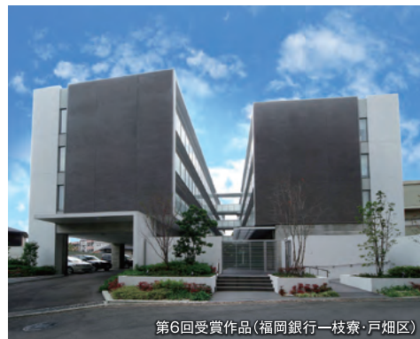
第6回受賞作品(福岡銀行一枝寮・戸畑区)