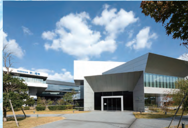
第9回受賞作品(ロボット村(安川電機)・八幡西区)

戸建・集合住宅、商業ビル・店舗等の建築物で、 原則、新築・改修時の建築後、10年以内に完成したもの