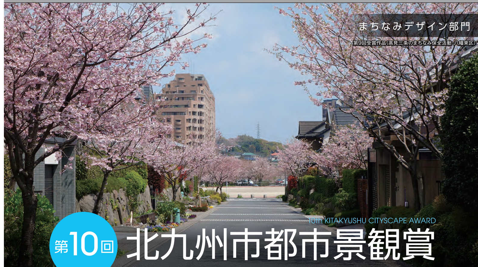
まちなみデザイン部門