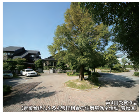
第4回受賞作品(青葉台ほんえんふ管理組合の住環境保全活動・若松区)